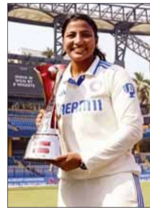
सात विकेट लेकर स्नेह बर्नी प्लेयर ऑफ द मैच

भारत की कुल 40 टेस्ट मैचों में सातवीं जीत