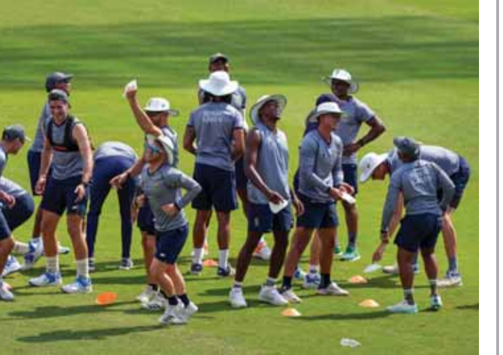
सेचुरियन। रविवार को सेचुरियन, दक्षिण अफ्रीका में भारत और दक्षिण अफ्रीका के बीच पहले टेस्ट क्रिकेट मैच से पहले अभ्यास सत्र के दौरान दक्षिण अफ्रीकी खिलाड़ी।